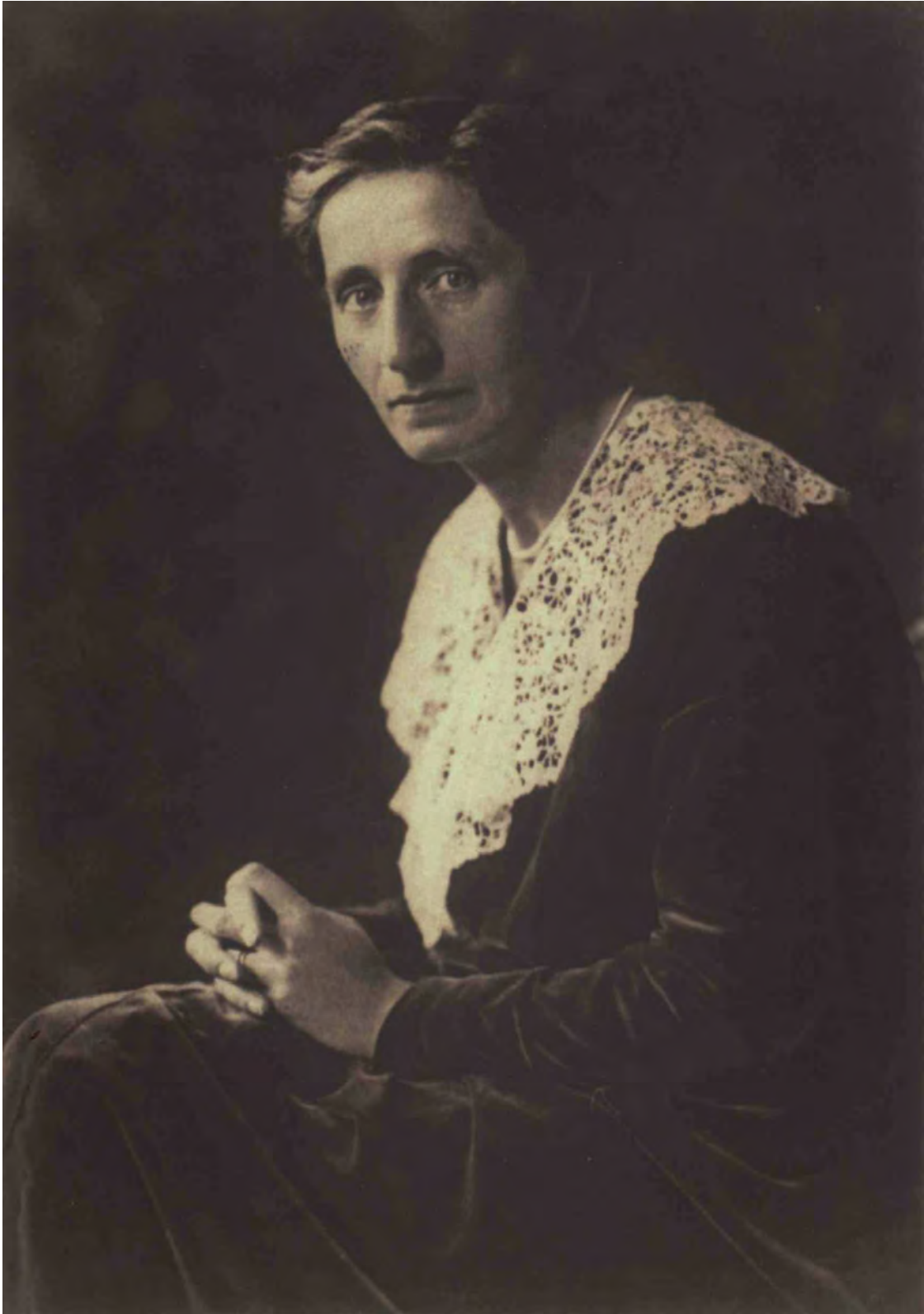
Alice Salomon 1872 - 1948